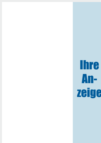
1/3 Seite Hochformat

Format: 68 x 297 mm zzgl. 3mm Randbeschnitt